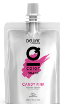
Candy Pink 200 мл (apt. DCPINK)