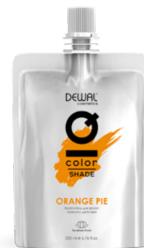
Orange Pie 200 мл (apt. DCPIE)

Каким ты видишь цвет сегодня? – Дерзкий и яркий или мягкий и пастельный? Пять оттенков помогут поддержать цвет окрашенных волос или примерить цветовой нюанс, который со временем вымоется полностью и без остатка. Они безопасны, просты и эффективны в использовании, не требуют смешивания с активаторами.