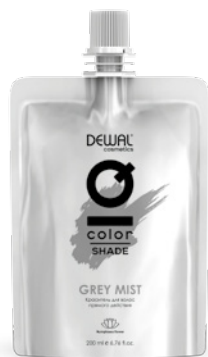
Grey Mist 200 мл (apt. DCGREY)