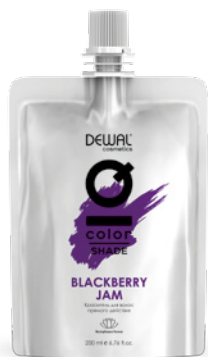
Blackberry Jam 200 мл (apt. DCBERRY)