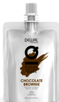
Chocolate Brownie 200 мл (apt. DCBROWN)